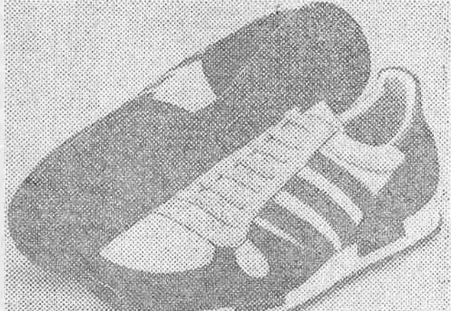
De Castella Competition