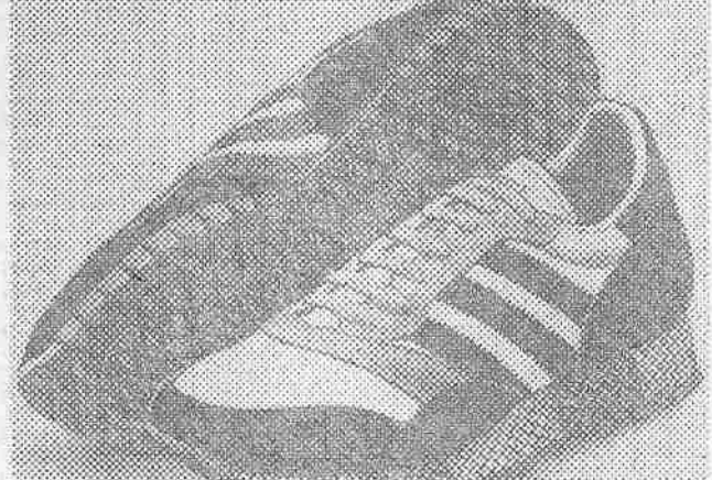
De Castella Trainer